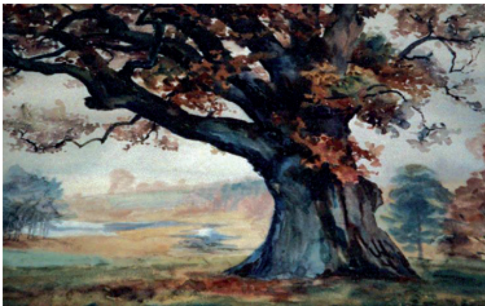
Dąb „Bartek” koło Zagnańska, jesień 1944 (okres świętokrzyski) Oak “Bartek”, near Zagnańsk, autumn 1944 (świętokrzyski period)