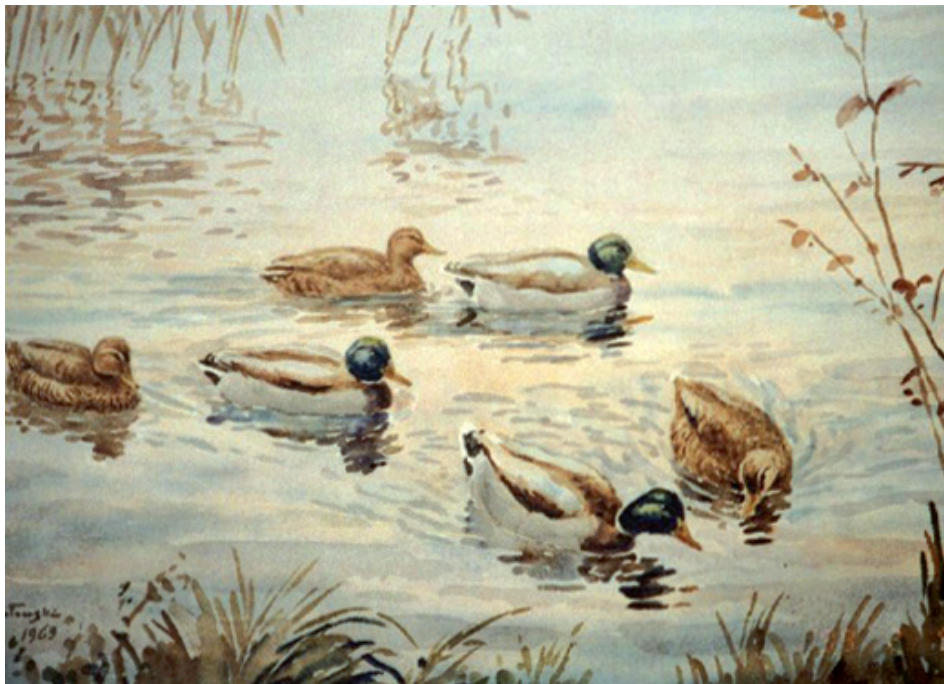
Krzyżówki, Poznań, Sołacz, 1969 Mallard, Poznań, Sołacz, 1969