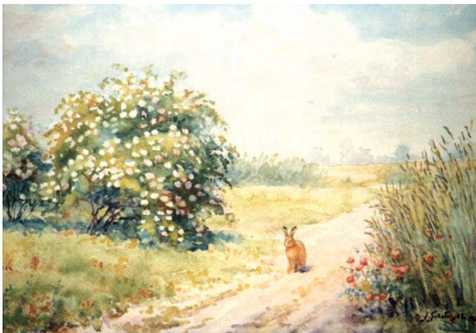
Zajac, Wielkopolska, 1972 Hare, Wielkopolska, 1972