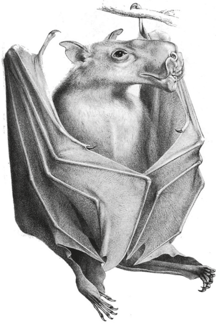
Ryc. 11. Młotogłów wielkogłowy Hypsignathus monstrosus jest jednym z największych nietoperzy występujących w Afryce ( https://free-images.com/display/hammer_headed_bat_hypsignathus.html )

Fig. 11. The hammer-headed bat Hypsignathus monstrosus is one of the biggest bats in Africa ( https://free-images.com/display/hammer_headed_bat_hypsignathus.html )