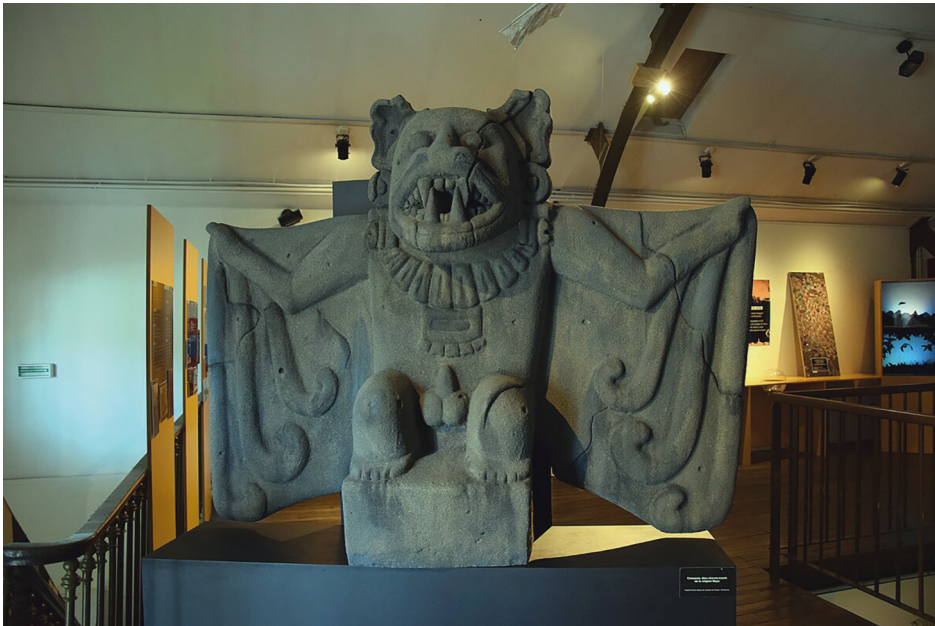
Ryc. 14. Majańska rzeźba przedstawiająca Camatzotz, boga śmierci i nocy, prezentowanego zwykle pod postacią nietoperza (ze zbiorów Muzeum Historii Naturalnej w Bourges, https://commons.wikimedia.org/wiki/File:Mus%C3%A9um_d%27histoire_naturelle_de_Bourges_camazolz_dieu_maya.jpg )