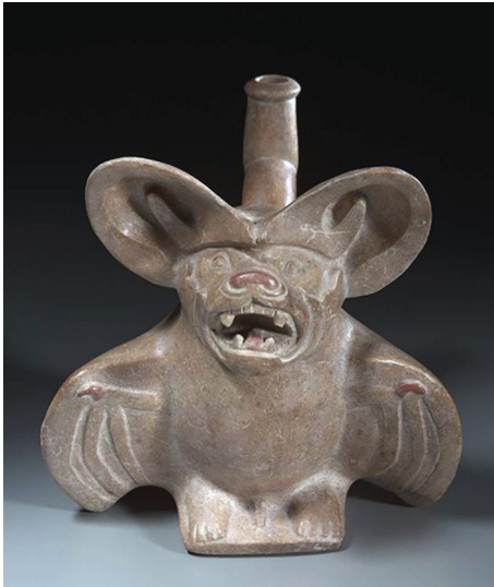
Ryc. 13. Ceramiczne naczynie z wizerunkiem nietoperza, pozostałość kultury Moche, obecnie w zbiorach Cleveland Museum of Art ( https://picryl.com/media/central-andes-north-coast-moche-people-early-intermediate-period-mastiff-dog-5a3fca )