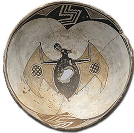
Ryc. 12. Ceramiczna miska wytworzona między 1000 a 1250 r. w nurcie „kultury Mimbres”. Należy do kolekcji Frederick R. Weisman Art Museum, Uniwersytetu Minesoty ( https://archive.archaeology.org/0805/etc/artifact.html )

Fig. 11. The hammer-headed bat Hypsignathus monstrosus is one of the biggest bats in Africa ( https://free-images.com/display/hammer_headed_bat_hypsignathus.html )