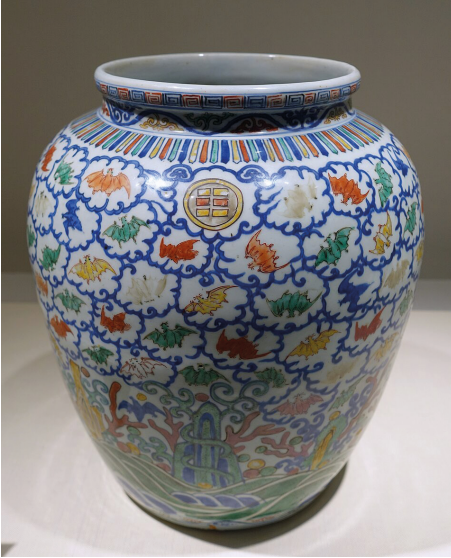
Ryc. 9. Porcelanowa waza z wizerunkiem „setki nietoperzy” pochodząca z czasów panowania cesarza Wanli w Chinach (1573–1620) ( https://commons.wikimedia.org/wiki/File:Jar_with_%27hundred_bats%27_design,_China,_Jingdezhen_kiln,_Ming_dynasty,_Wanli_period,_1573-1620,_overglaze_enamels_-_Matsuoka_Museum_of_Art_-_Tokyo,_Japan_-_DSC07224.JPG )

Fig. 9. Porcelain vase with a depiction of “a hundred bats” from the reign of Emperor Wanli in China (1573–1620) ( https://commons.wikimedia.org/wiki/File:Jar_with_%27hundred_bats%27_design,_China,_Jingdezhen_kiln,_Ming_dynasty,_Wanli_period,_1573-1620,_overglaze_enamels_-_Matsuoka_Museum_of_Art_-_Tokyo,_Japan_-_DSC07224.JPG )