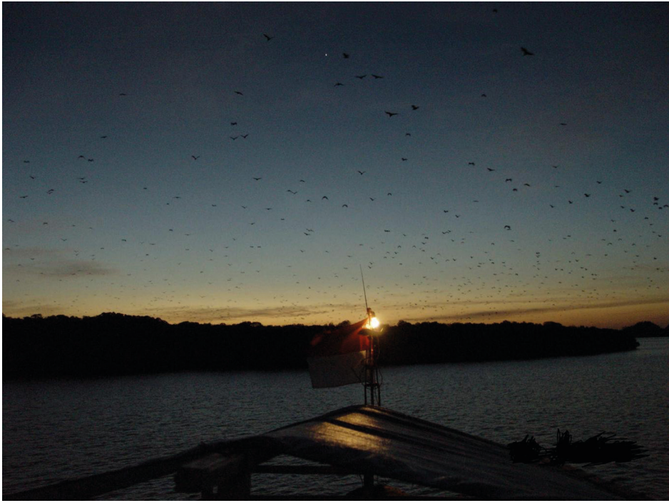
Ryc. 1. Nietoperze występują niemal wszędzie tam, gdzie ludzie ( https://free-images.com/display/pulau_kalung2.html )