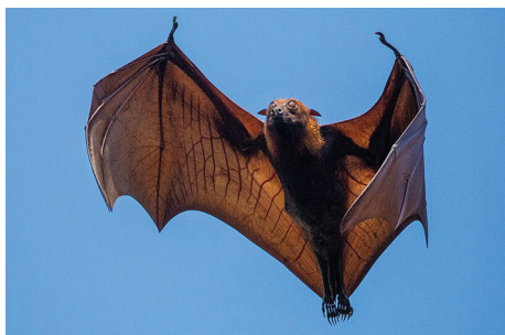
Ryc. 7. Rudawka malajska Pteropus vampyrus. Rozpiętość skrzydeł tych nietoperzy może wynosić nawet 150 cm. Ich głównym pożywieniem są owoce, choć gatunkowa nazwa vampyrus tego nie sugeruje

Fig. 7. The Malayan flying fox Pteropus vampyrus. The wingspan of these bats can reach up to 150 cm. Their primary source of food are fruits, even though the species name vampyrus suggests otherwise