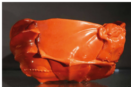
Ryc. 8. Chińska miska przedstawiająca pięć połączonych ze sobą nietoperzy, datowana na XIX w. Motyw pięciu nietoperzy pojawia się również w popularnym chińskim talizmanie Wu Fu, gdzie każdy z nich odnosi się do jednego z pięciu rodzajów szczęścia: długowieczności, bogactwa, zdrowia, czynienia dobra i przeżycia wszystkiego, co los przeczyna (https://picryl.com/media/bowl-with-bats-bm-pdf524-f9b6f0)

Fig. 7. The Malayan flying fox Pteropus vampyrus . The wingspan of these bats can reach up to 150 cm. Their primary source of food are fruits, even though the species name vampyrus suggests otherwise (Twardowski, Twardowska 2018, https://commons.m.wikimedia.org/wiki/File:Pteropus_vampyrus_435399917.jpg )