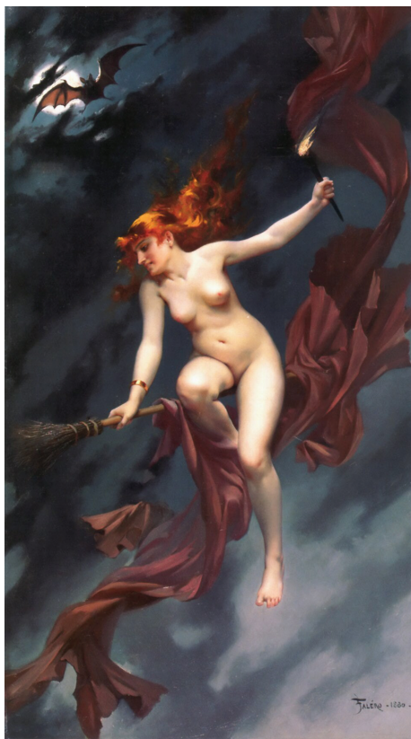
Ryc. 3. Muse of the Night (przed 1896) – obraz namalowany przez Luisa Ricardo Falero, przedstawiający postać czarownicy oraz nietoperza ( https://commons.wikimedia.org/wiki/File:The_witches_Sabbath,_by_Luis_Ricardo_Falero.jpg )

Fig. 3. Muse of the Night (before 1896) – a painting created by Luis Ricardo Falero, showing a witch and a bat ( https://commons.wikimedia.org/wiki/File:The_witches_Sabbath,_by_Luis_Ricardo_Falero.jpg )