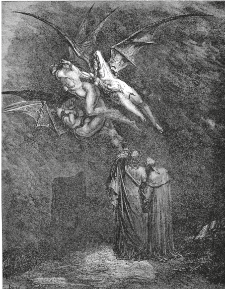
Ryc. 2. Megaera, Tyzifona i Alekto. Ilustracja Gustave'a Doré do pieśni IX Boskiej Komedii Dantego Alighieri ( https://commons.wikimedia.org/wiki/File:DVinfernoMegaeraTisifphoneAlecto_m.jpg )