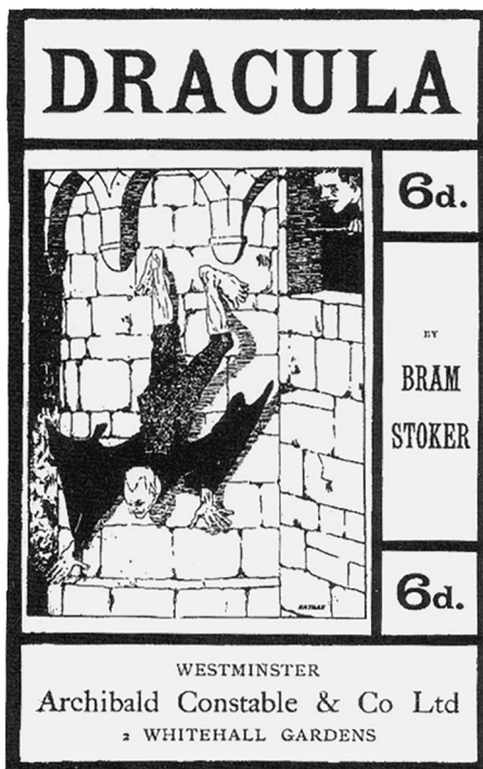
Ryc. 5. Okładka pierwszego druku poprawionego tekstu „Drakuli” Brama Stokera, Westminster: Archibald Constable and Company, 1901 ( https://commons.wikimedia.org/wiki/File:Dracula_Archibald_Constable_and_Company_1901.jpg )