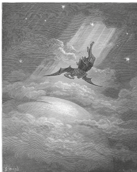
Ryc. 4. The spiritual descent of Lucifer into Satan – ilustracja Gustave'a Doré (1866) do Raju utraconego Johna Milтона ( https://commons.wikimedia.org/wiki/File:Paradise_Lost_12.jpg )

Fig. 3. Muse of the Night (before 1896) – a painting created by Luis Ricardo Falero, showing a witch and a bat ( https://commons.wikimedia.org/wiki/File:The_witches_Sabbath,_by_Luis_Ricardo_Falero.jpg )