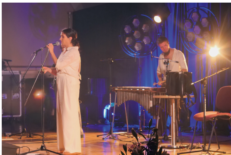
Ryc. 1. Artyści podczas koncertu Warszawskiej Orkiestry Sentymentalnej, 28.10.2023 r.