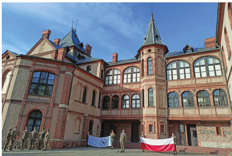
Ryc. 8. Uroczyste wciągnięcie flag na maszt podczas obchodów rocznicy odzyskania przez Polskę niepodległości, 11.11.2023 r.

Fig. 7. The audience gathered on the meadow next to the Annexe building during the Forest Festival, June 5, 2022 (photo by Archives of the Forest Culture Center in Gołuchów)