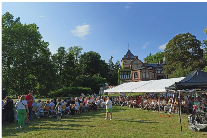
Ryc. 7. Publiczność zgromadzona na łące u stóp Oficyny podczas Festiwalu Lasu, 5.06.2022 r.

Fig. 7. The audience gathered on the meadow next to the Annexe building during the Forest Festival, June 5, 2022 (photo by Archives of the Forest Culture Center in Gołuchów)