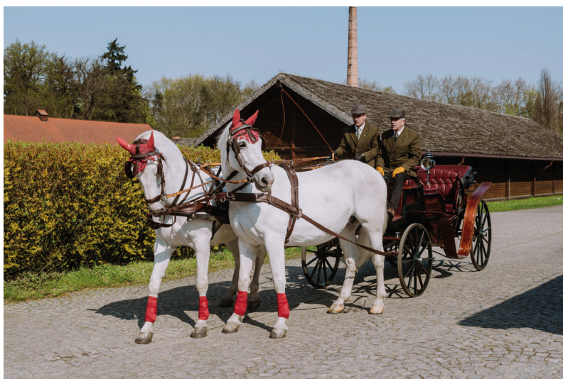
Ryc. 5. Przejazd dorożki zaprzęgniętej w konie podczas wernisażu wystawy Koń wiernym przyjacielem leśnika, 28.04.2023 r.