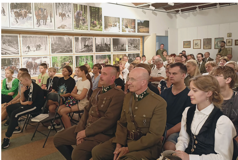
Ryc. 6. Publiczność podczas promocji książki „W cieniu Puszczy Białowieskiej”, 8.09.2023 r.